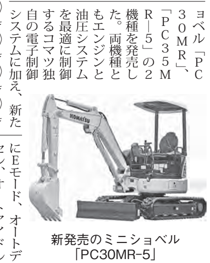
新発売のミニショベル「PC30MR-5」

ヨベル「PC30MR」の「PC35MR-5」の2機種を発売した。両機種ともエンジンと油圧システムを最適に制御するコマツ独自の電子制御システムに加え、新たにEモード、オートアイドルストップ機能、ダイヤル式燃料コントロールを採用、従来機の作業性能を維持しながら燃料消費量を7%低減した。 また作業機レバーユニットラル検出機能、セカンダリエンジン停止スイッチ、およびシートベルト未装着警報などを新たに追加し安全性を高めた。さらに多くの情報を見やすく表示する3.5インチカラー液晶多機能モニターが取得可能なデータが大幅に増えたKOMTRAXの装備により、機械稼働の「見える化」を推進。キャブ仕様では、新設計の大型ドアの採用やエアコンを標準装備、より快適なオペレータ空間を実現。国土交通省第3次排出ガス基準にも適合して